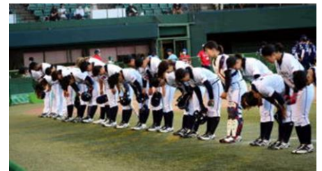
応援団席に挨拶する日立選手