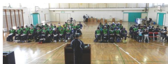
審判員・記録員 参加者の皆さん